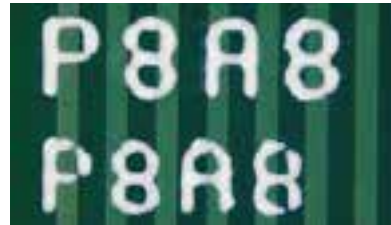
原有技术: 未采用 DotStream Pro™ 技术, 0.7 和 0.6mm 文字单趟模式, 26 秒**