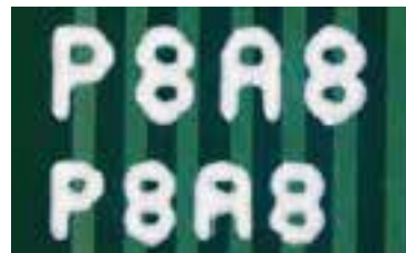
最新技术: 采用 DotStream Pro™ 技术, 0.7 和 0.6mm 文字单趟模式, 15秒** (Orbotech Sprint 200)