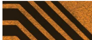
성형 후 백색광 이미지