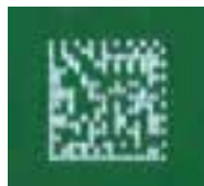
2.5mm x 2.5mm