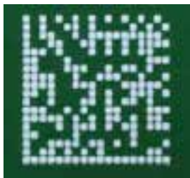
5mm x 5mm