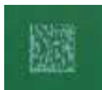
1.5mm x 1.5mm