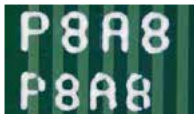
従来モデルでの0.7mmおよび0.6mmのテキスト印刷 印刷モード: 1パス、印刷時間: 26秒**