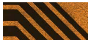
シェイピング後 白色光画像